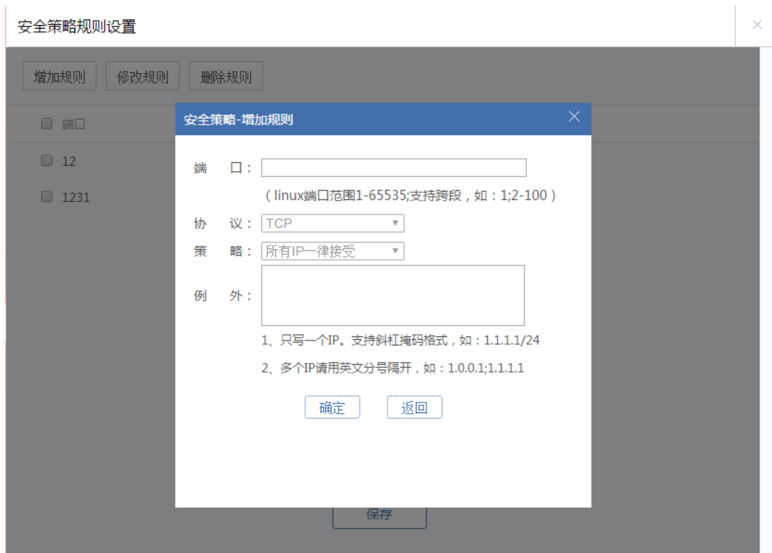
图 5.2.7 安全策略-增加规则