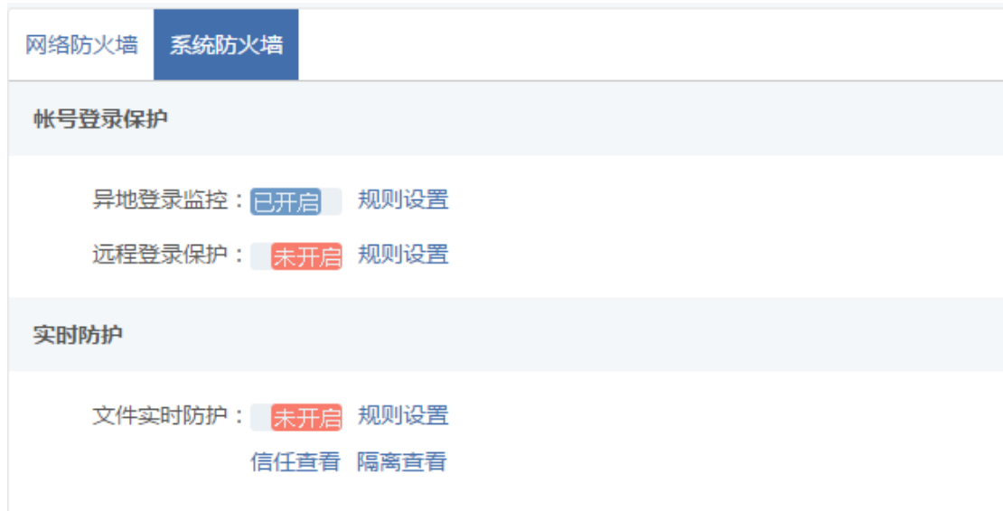
图 5.3.1 服务器安全防护-系统防火墙