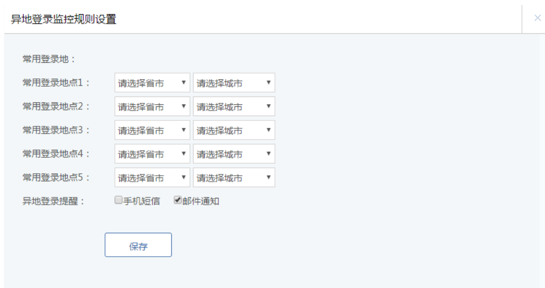
图 5.3.2 系统防火墙-异地登录提醒