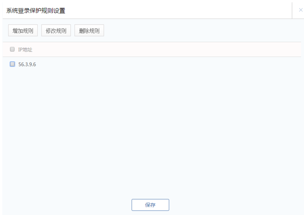
图 5.3.3 系统防火墙-远程登录保护

通过阻止未授权的用户远程登录，为服务器提供实时、主动的 SSH 远程桌面登录保护。在此功能中，用户可以设置允许远程登录的白名单等。