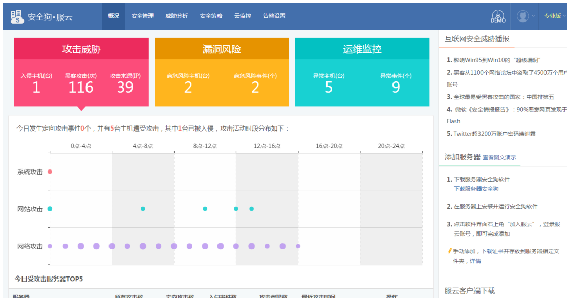
图 5.1.4 服云-登录首页