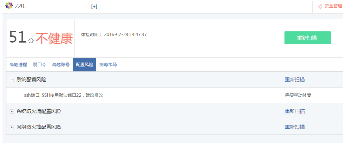
图 5.4.1 安全体检