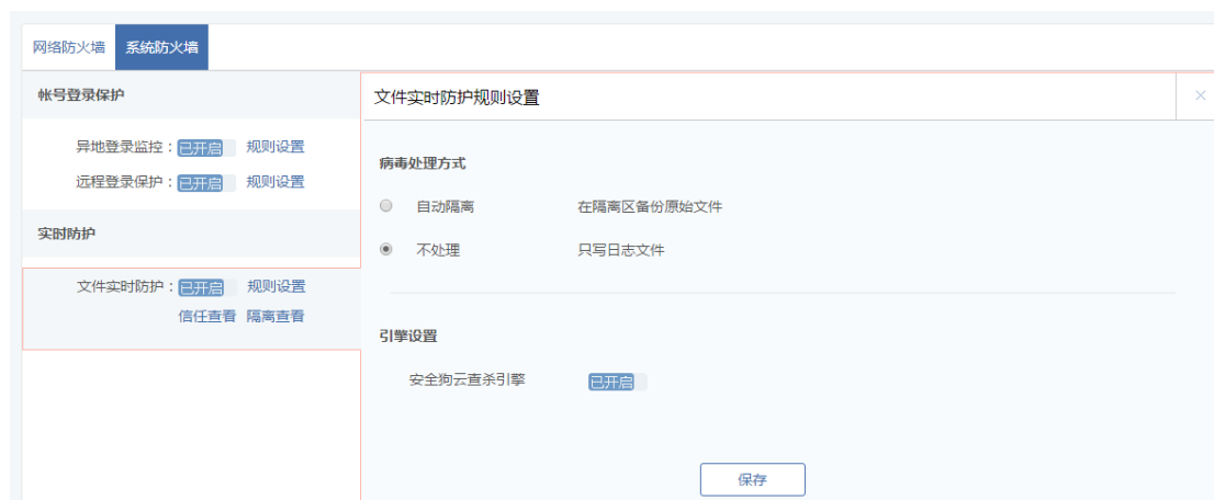
图 5.3.5 系统防火墙-文件实时防护