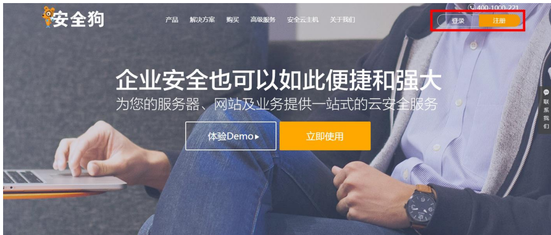
图 5.1.1 服云

步骤 1: 打开安全狗官网 http://www.safedog.cn ，登录服云账号，进入“我的服云”，即可方便设置相应的服务器防护功能，告别必须登录服务器才能操作的传统方式。