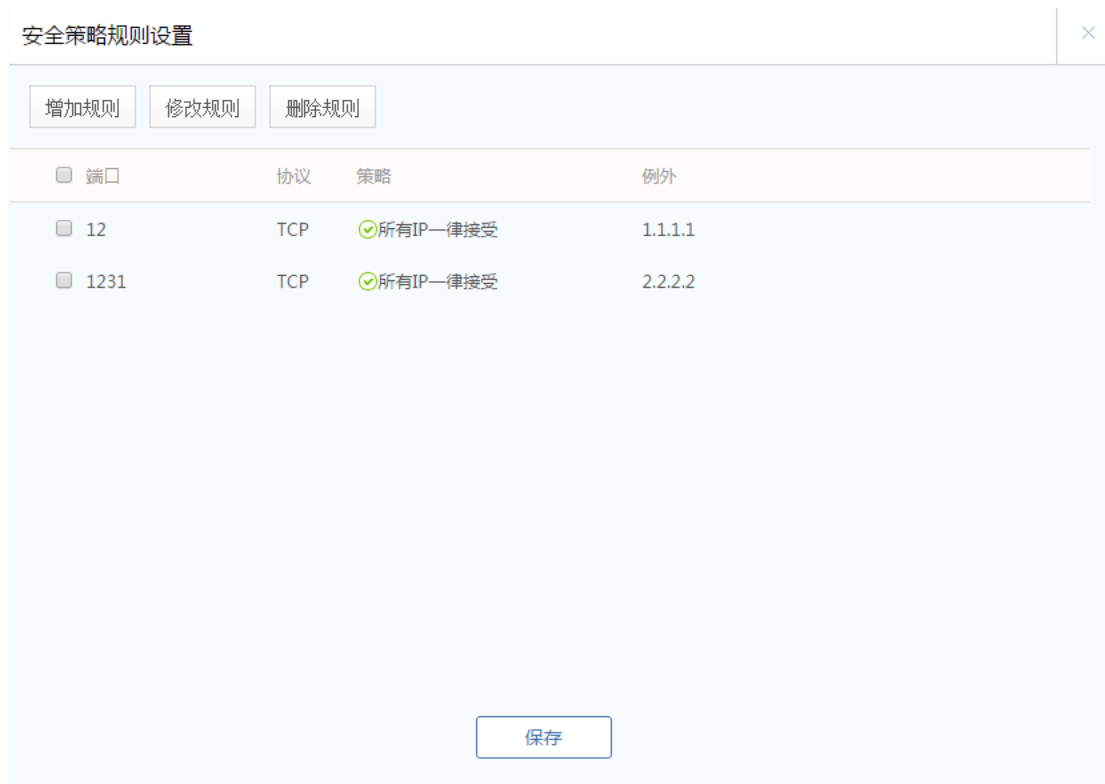
图 5.2.6 网络防火墙-安全策略

安全策略功能通过执行具体的端口保护规则，限制或者允许对端口的连接请求，从而保护服务器安全。