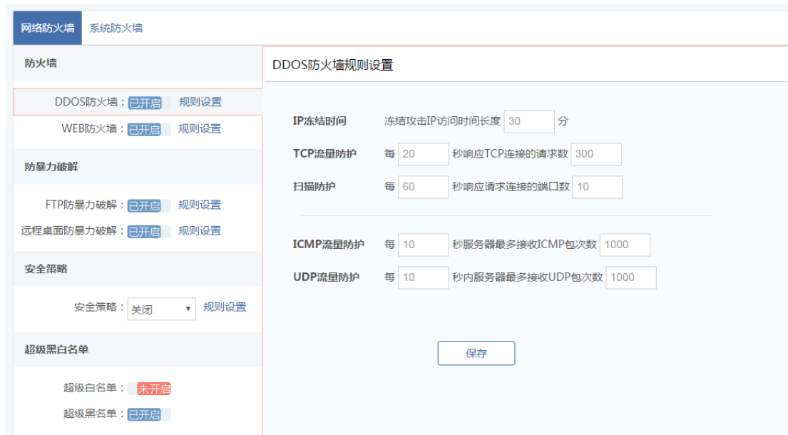
图 5. 2. 1 网络防火墙-DDOS 防火墙

(1) 已开启/已关闭：显示当前 DDOS 防火墙功能的开关状态，支持开启/关闭。