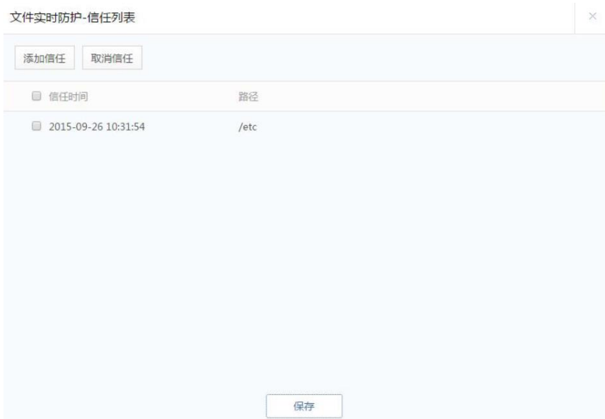
图 5.3.7 文件实时防护-信任查看