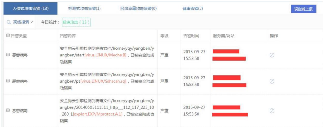
图 5.3.6 告警中心

不处理，即发现危险文件后，写日志文件，不进行隔离或其他操作。可在客户端指定路径查看日志，即 etc/safedog/monitor/rtdfend.txt 。