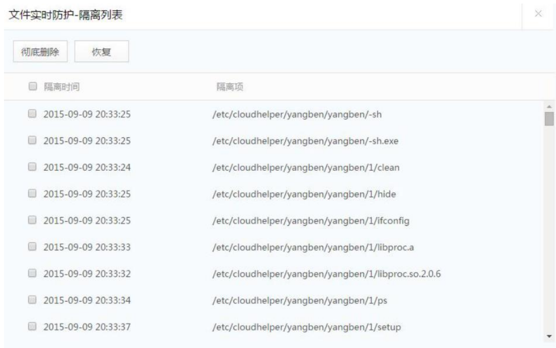
图 5.3.9 文件实时防护-隔离查看

显示已隔离的文件或文件夹，支持客户端彻底删除和恢复操作，特别注意，删除后无法恢复，请谨慎操作。