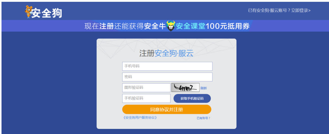
图 5.1.3 服云-注册