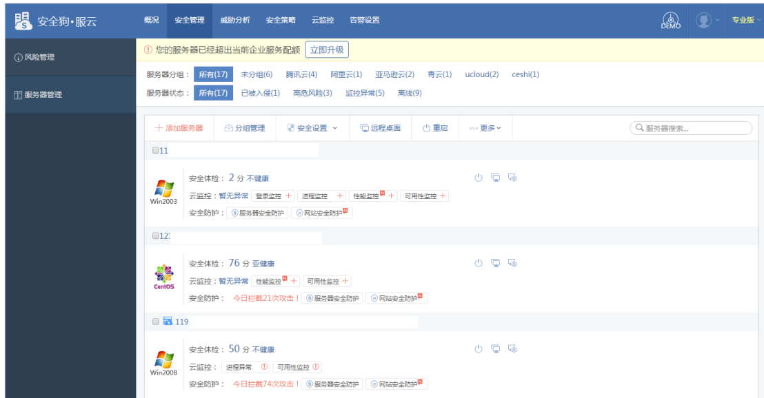
图 5.1.6 服云-服务器管理