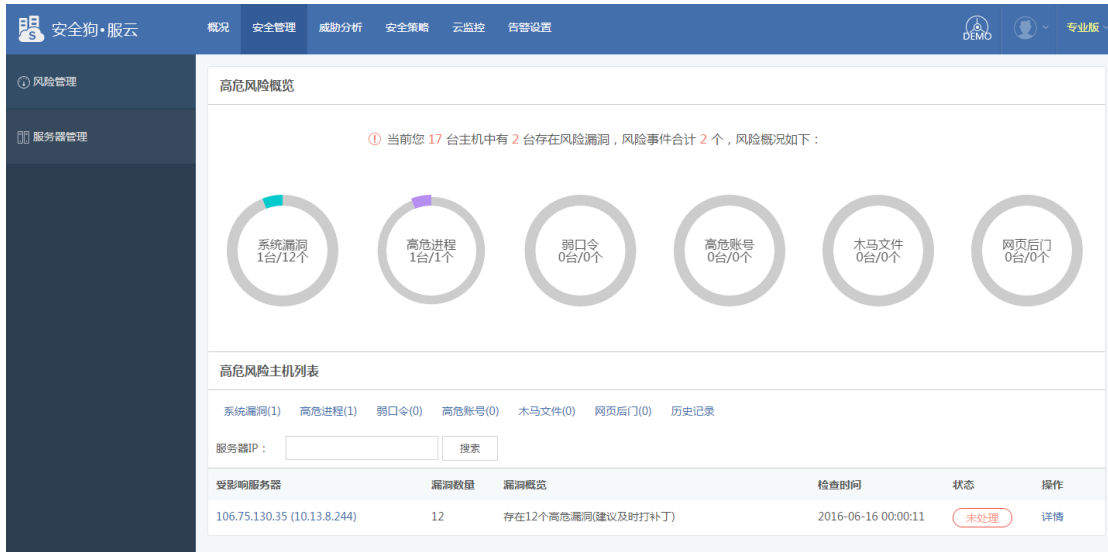
图 5.1.5 服云-风险管理