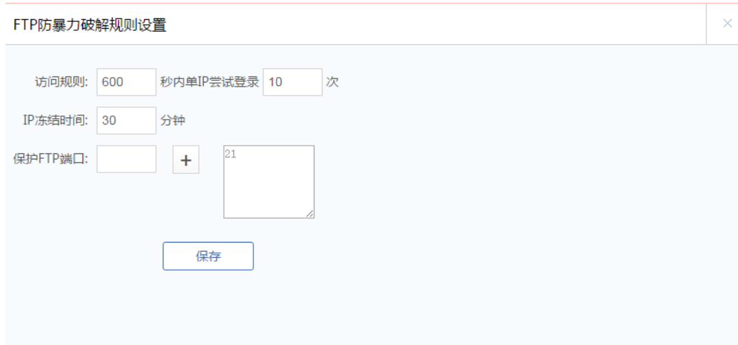
图 5.2.4 网络防火墙-FTP 防暴力破解

(1) 已开启/已关闭: 显示当前 FTP 防暴力破解功能的开关状态, 支持开启/关闭。