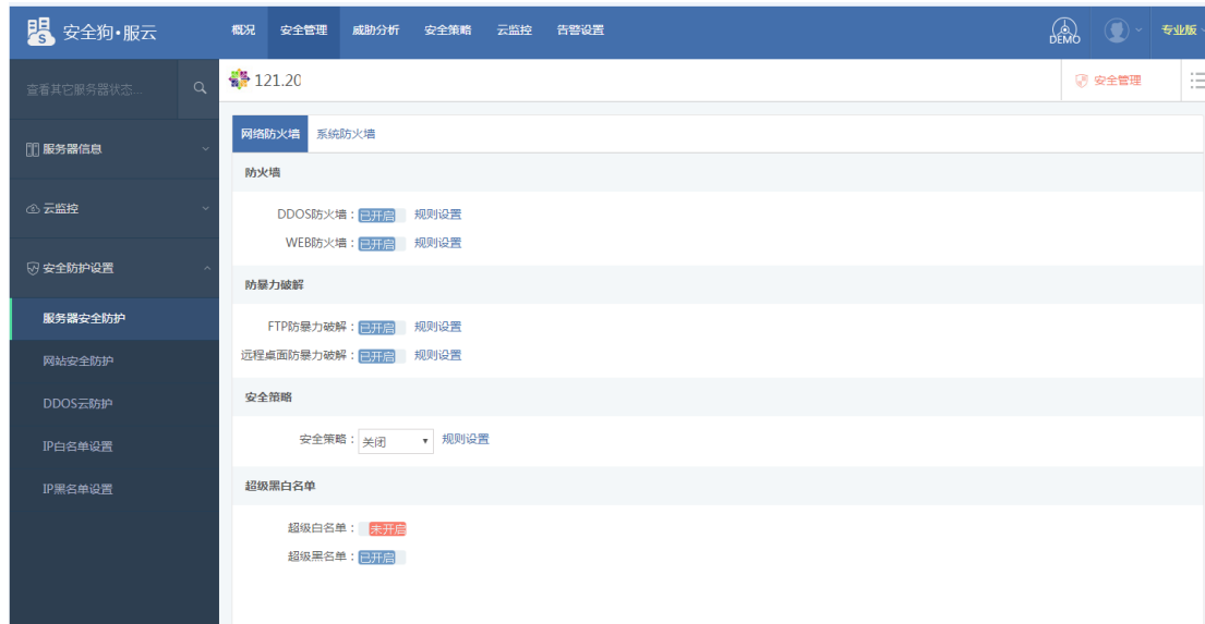
图 5. 1. 8 服云-服务器安全防护