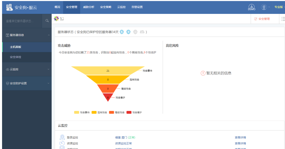
图 5. 1. 7 服云-主机面板