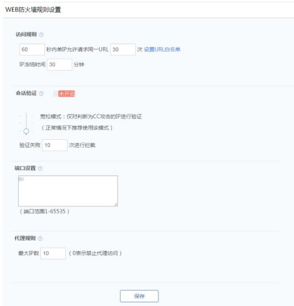
图 5.2.2 网络防火墙-Web 防火墙

(1) 已开启/已关闭：显示当前 Web 防火墙功能的开关状态，支持开启/关闭。