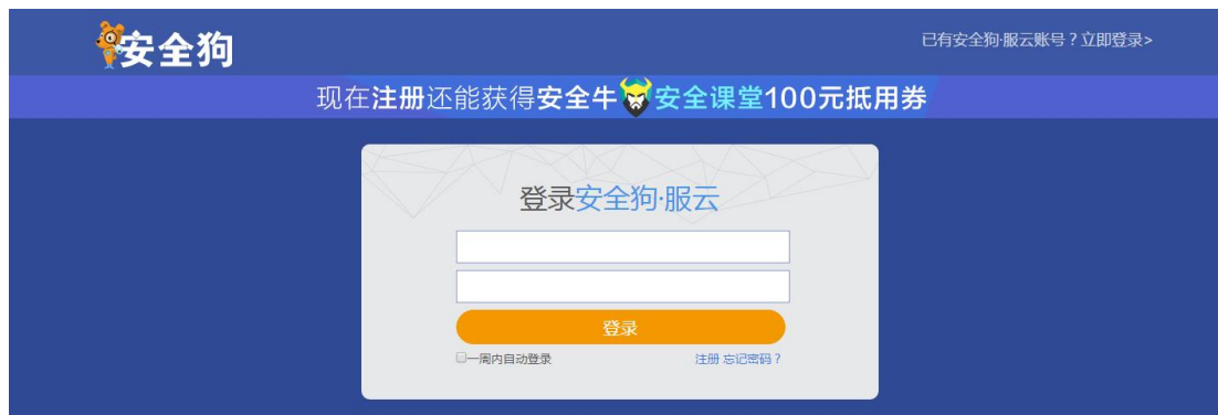
图 5.1.2 服云-登录