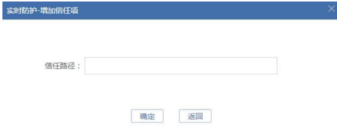
图 5.3.8 信任查看-添加信任