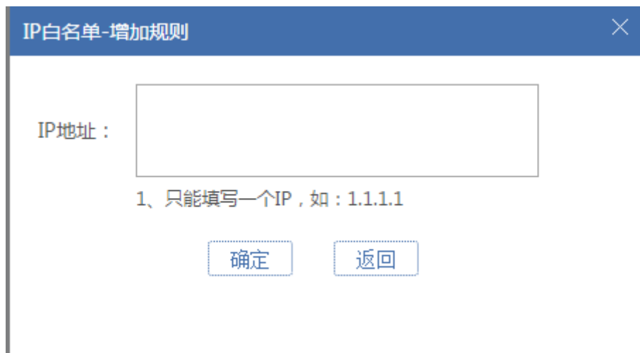
图 5.3.4 远程登录保护-增加 IP 白名单